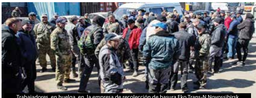
Trabajadores en huelga, en la empresa de recolección de basura Eko Trans-N Novosibirsk

La guerra provocó una crisis sin precedentes en el Partido Comunista, cuyos líderes, explica uno de nuestros corresponsales, "como era de esperar, defendieron una posición chovinista apoyando la guerra" . Un líder del Komsomol (Juventud Comunista) en una región nos explica: "En la organización del Partido Comunista de nuestra ciudad, todos los jóvenes