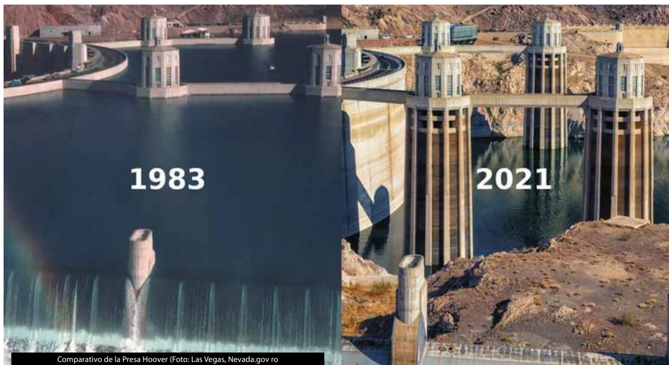
Comparativo de la Presa Hoover

La Casa Blanca presentó recientemente un plan para la gestión de los recursos hídricos a nivel mundial, que busca el supuesto "acceso equitativo al agua", este plan traza que EUA debe ser el líder de esta iniciativa.