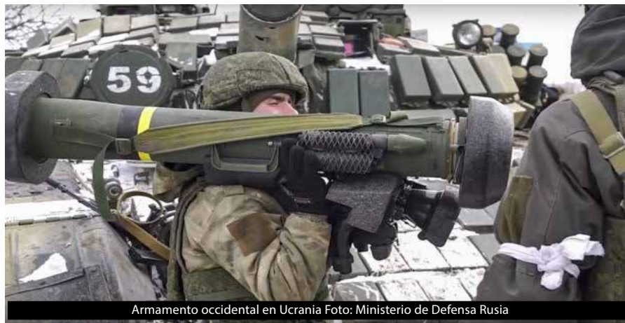
Armamento occidental en Ucrania

El 28 de abril, Biden anuncia que los Estados Unidos elevarían a 33 mil millones de dólares su "ayuda a Ucrania" (de los cuales 20 mil millones son en ayuda militar). Siete veces más de lo atribuido hasta entonces. "Nuestros aliados de la OTAN y de la Unión Europea pondrán igualmente su parte" precisó Biden, exigiendo a las grandes potencias europeas el pasar a la caja registradora, lo mismo que hicieron el 5 de mayo en Varsovia (Polonia), en una conferencia internacional de donadores. Se reunieron más de 6 mil millones de euros destinados a la guerra de Ucrania. Macron anunció ahí mismo que aumenta su "ayuda a Ucrania" hasta los 1.9 mil millones de dólares, o sean 284 millones de euros suplementarios.