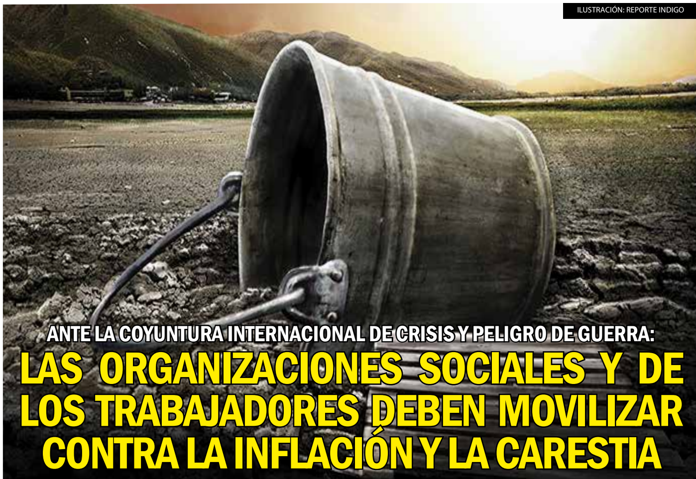
ILUSTRACIÓN: REPORTE INDIGO

ANTE LA COYUNTURA INTERNACIONAL DE CRISIS Y PELIGRO DE GUERRA: LAS ORGANIZACIONES SOCIALES Y DE LOS TRABAJADORES DEBEN MOVILIZAR CONTRA LA INFLACIÓN Y LA CARESTIA