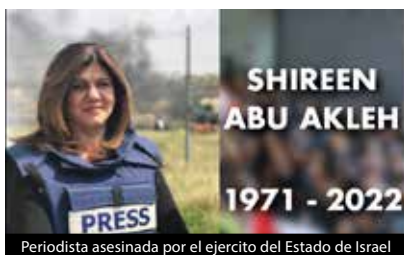
Akleh, periodista palestina de 51 años, ha muerto

El 13 de marzo de 2022, un periodista estadounidense, Brent Renaud, de 51 años, fue asesinado en Irpin (Ucrania) a tiros. El principal diario estadounidense, el New York Times, titula: "Brent Renaud, un periodista estadounidense, fue asesinado en Ucrania" . Dos meses después, la periodista palestina Shireen Abou Akleh, de 51 años, recibió un disparo en la cabeza de un francotirador del ejército israelí en las afueras de Jenin, aunque estaba identificada por un chaleco de "Prensa". El mismo New York Times titulaba el 12 de mayo: "Shireen Abou