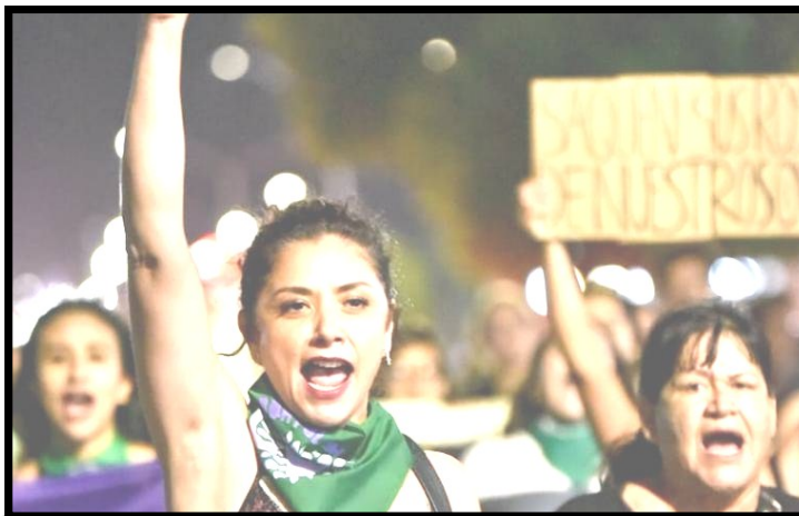
Aspecto de la marcha por el derecho a decidir en Mexicali 28 de Septiembre

Las mujeres en México nos enfrentamos a la discriminación jurídica que implica tener menores derechos, además de la visión machista y conservadora de funcionarios, políticos y del gran control que establecen iglesias y cultos, algunas Clínicas o médicos privados se ven beneficiados con esta situación, al cobrar grandes cantidades, como parte de un negocio que puede poner en riesgo a las mujeres al no estar regulari-