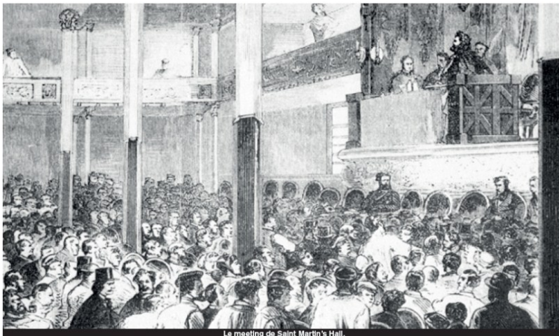
La meeting de Saint Martin's Hall.

Reúne a su interior a todas las corrientes del movimiento obrero que se afirman como una fuerza social. Por primera vez, la Internacional de los Trabajadores, necesaria para la lucha emancipadora de los trabajadores, encontró una forma organizada.