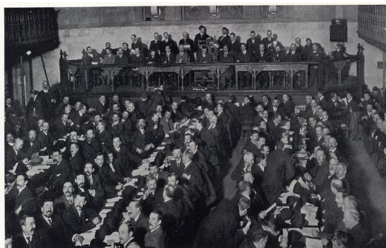
THE SIXTH ANNUAL CONFERENCE OF THE LABOUR PARTY. MEMORIAL HALL, FAREHAM STREET, LONDON, E.C., FEBRUARY 12TH, 10TH, AND 17TH, 1906.

El cronograma, entonces establecido, es que el Congreso TUC siempre precede al de los laboristas, que se supone que debe ordenar sobre la base de las demandas formuladas en los sindicatos. La realidad de este mandato y su respeto son otra historia.