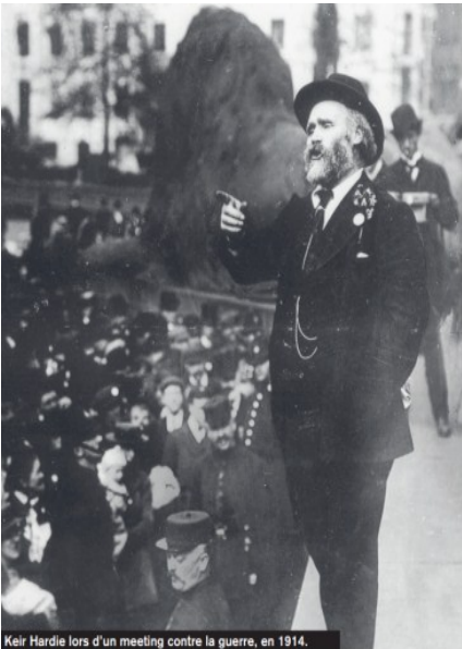
Keir Hardie lors d'un meeting contre la guerre, en 1914.

En 1856 en North Lanarkshire, Escocia, a los 8 años, James Keir Hardie trabajo como un camarero cuando sus padres estaban desempleados. A los 11 años, fue contratado en la mina. En 1880 dirigió la primera huelga de mineros en Lanarkshire.