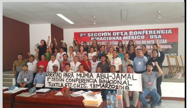
Foto: Segunda Conferencia binacional contra el TLCAN 18 de marzo de 2018 Tuxtla Gutiérrez, Chiapas.

Una vez que la Comisión Organizadora de la Conferencia Binacional decida la hora exacta de la conferencia, de manera simultánea, nos conectaremos desde los diversos lugares. En Comitán la responsabilidad de organizar la Conferencia Virtual recae sobre militantes del CCL-40 y del Sidet-Cecytech, en Palenque en compañeros del sector salud, en San Cristóbal, sector salud y magisterio, en Tuxtla Gutiérrez, sector urbano, salud, magisterio...y por supuesto los militantes de la OPT, de la NCT y de la LCI-CORCI: vamos a presentar esta invitación y extenderla a los compañeros de la OCD del vecino municipio de Suchiapa, a los petroleros de Veracruz y militantes sociales de Tabasco; para que se sumen a la conferencia virtual.