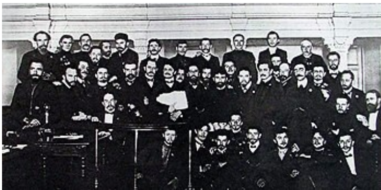
Trotsky presidiendo el Soviet de Petrogrado en 1905

Trotsky fue encarcelado y enviado de nuevo a Siberia, de la que escapó para residir en Suiza. “En Viena, desde el mes de octubre de 1908, publicábamos un periódico ruso con el nombre Pravda (La Verdad), destinado al gran público obrero. Lo pasábamos a Rusia de contrabando, parte por la frontera de Galizia y parte por el Mar Negro. La publicación duró tres años y medio, y aunque sólo aparecía dos veces al mes, nos imponía un trabajo enorme y fatigoso. Las comunicaciones por