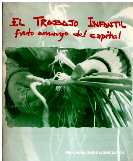
Portada del libro El trabajo Infantil fruto amargo del capital, editado por la UABC IIS 1998