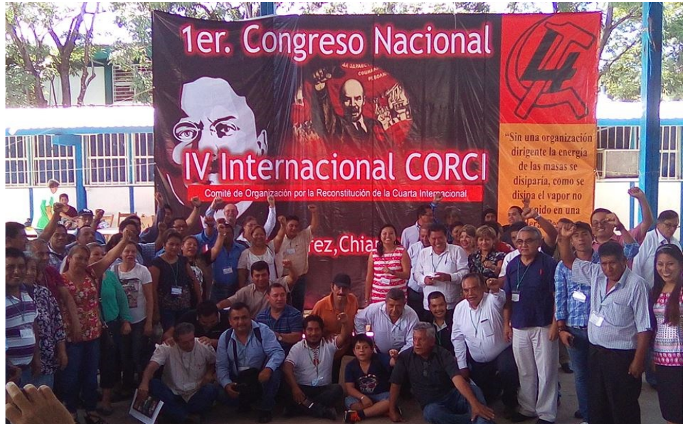
Imagen de los asistentes al 1er. Congreso Nacional del CORCI, en Tuxtla Gutiérrez, Chiapas.

A propósito del proceso independentista de Cataluña, vemos que en México la cuestión de la independencia nacional queda aún pendiente, que las aspiraciones de la