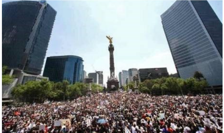
Miles salieron a las calles en rechazo a la imposición de EPN. CDMX, diciembre 2012

Muchos políticos y grupos empresariales han leído bien hacia donde se orienta el voto y se han sumado al MORENA en búsqueda de conservar sus cargos públicos, haciendo caso a la Máxima "cambiar