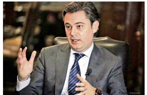
En la foto, Aurelio Nuño, Secretario de Educación Pública

hechos el 6 de abril. La comunicación de ambas modificaciones se dio a través de los medios de comunicación, sin discusión previa y sin explicar claramente la necesidad de tal cambio, haciendo evidente una falta de voluntad para el diálogo, suscitando un escenario de desestabilización, pues se fomenta la