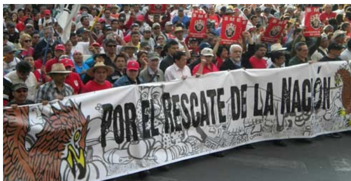
Trabajadores del Sindicato Mexicano de Electricistas durante movilización