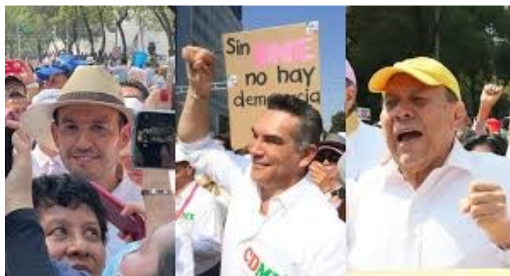
Dirigentes del PAN, PRI y PRD en la marcha “ciudadana” en defensa del INE

Hoy el sistema electoral mexicano es el más caro del mundo, el presupuesto invertido a nombre de mantener la democracia va a parar a las manos de unos cuantos funcionarios, líderes de partidos y sus empresas.