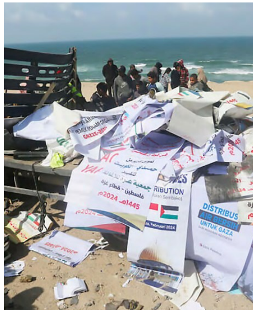
Escena de un camión de ayuda humanitaria bombardeado por el ejército del Estado de Israel el 3 de marzo