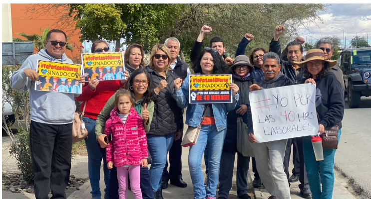
Jornada nacional por las 40 horas, concentración en Mexicali,