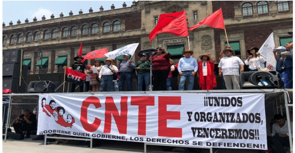
Mitin de la CNTE frente a Palacio Nacional, 15 de mayo de 2024

M: En primer lugar, hay que resaltar que el primer triunfo fue la movilización en sí misma, ya que durante algunos años la CNTE no había tenido la capacidad de movilizarse a nivel nacional o de sostener una acción como la que realizamos. En estas jornadas de lucha