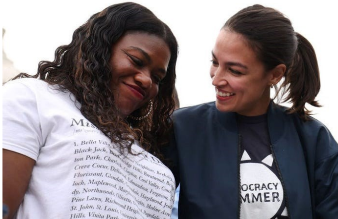
Representantes: Corey Bush y Alexandria Ocasio-Cortez

No, no se puede poner fin a las guerras de la OTAN, y no se puede abolir la OTAN mientras se llenan sus arcas de guerra. ¡Afirmar lo contrario es pura hipocresía!