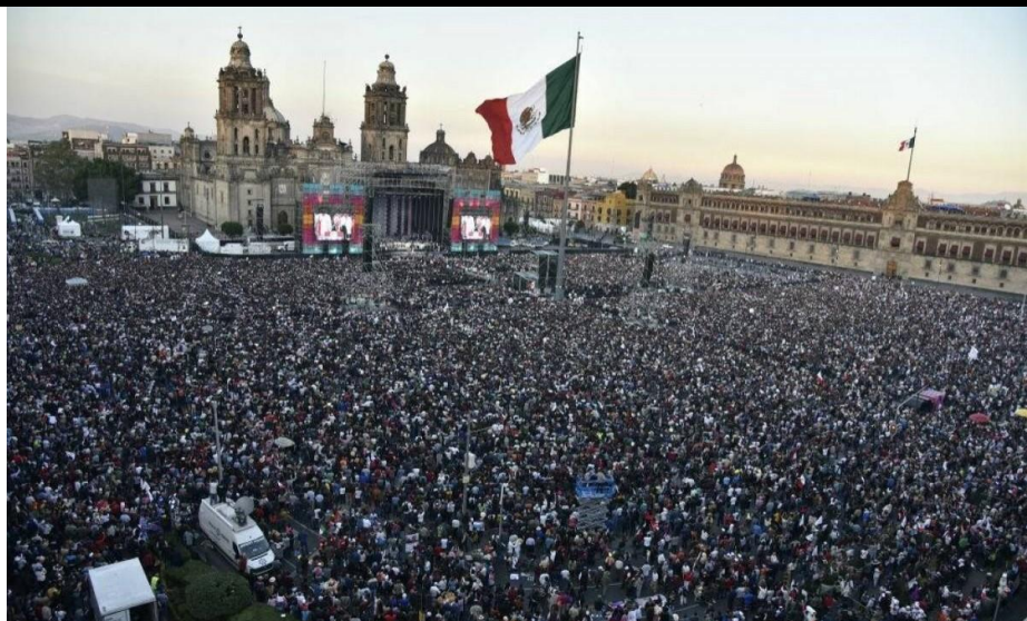
Mitin en el Zócalo de la Ciudad de México en el marco de la Toma de posesión de AMLO, 1ro de diciembre, 2018.

El 1ro de diciembre López Obrador ha rendido protesta como presidente de México y hace un juramento ante la nación. En su discurso destaca la defensa de la soberanía, los derechos humanos y nos invita a todos a emprender una 4ta transformación radical y profunda. La población que mayoritariamente votó por él, lo hizo dándole un mandato claro: echar a la corrupta mafia del poder y revertir las políticas que durante más de treinta años han empeñado la soberanía nacional, permitido el saqueo de nuestros recursos naturales y la destrucción de derechos, que han resultado en la situación de crisis permanente a la que se enfrenta la