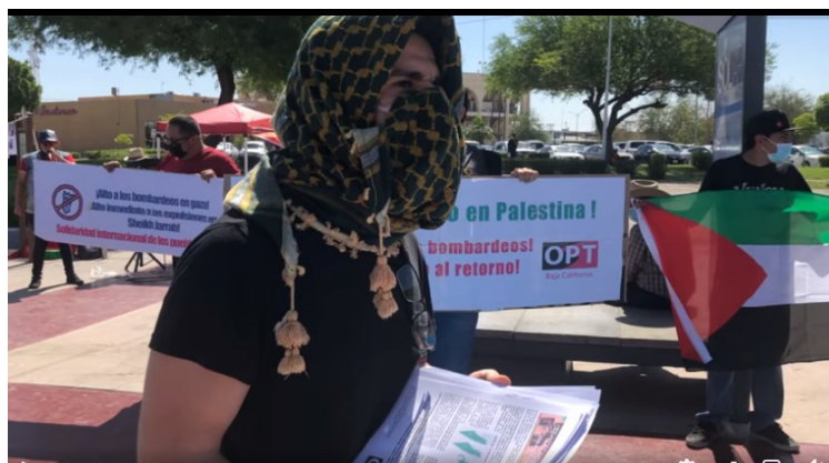
Acto internacionalista en apoyo a Palestina, Mexicali, BC, 19 de mayo de 2021

* La Nakba (la Catástrofe) implica la expulsión de 850 000 palestinos de sus ciudades y pueblos en mayo de 1948 -ndlt