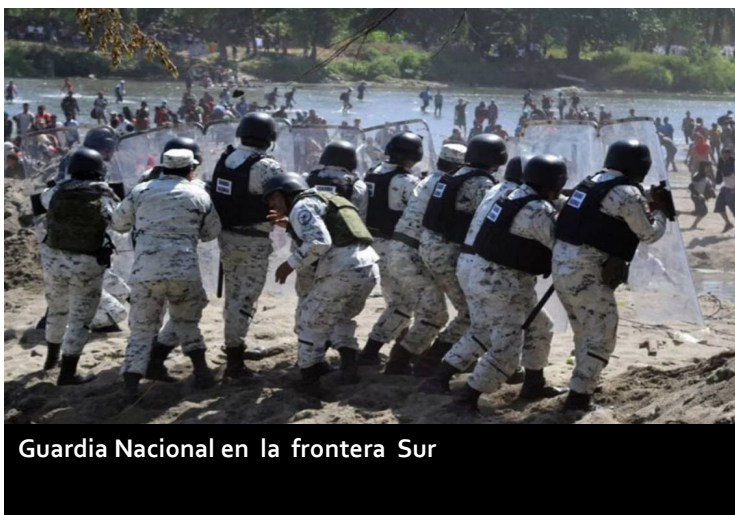
Guardia Nacional en la frontera Sur

to de la mano de obra calificada en México; la cercanía (que evitaría problemas de suministro como los sufridos durante la pandemia); el descubrimiento de amplias reservas de litio de fácil acceso y transportación.