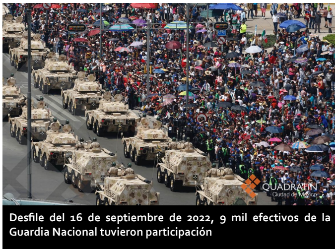
Desfile del 16 de septiembre de 2022, 9 mil efectivos de la Guardia Nacional tuvieron participación

Pero el imperialismo tiene otras prioridades. Este aumento al presupuesto del ejército mexicano es simplemente una farsa; con esto solo se ha logrado que la militarización en el país, estrategia que no ha sido para nada eficaz en la reducción de la violencia, esta se ha