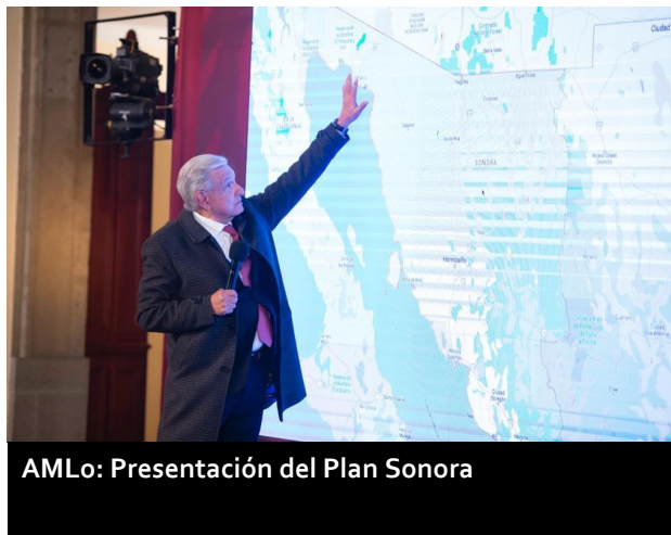
AMLO: Presentación del Plan Sonora

mil efectivos, surgió como una agencia “civil”, pero desde septiembre del 2022 se integró al ejército, bajo el mando de la Secretaría de Defensa (a la que el congreso acaba de permitir continuar con tareas de seguridad interior hasta 2028).